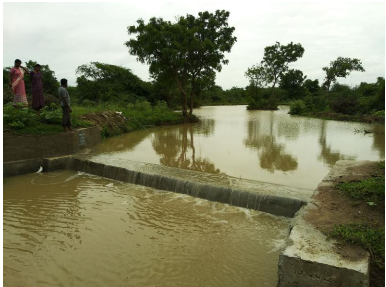
Wasser ist Leben

planten und überwachten sie selbst alle Maßnahmen. An den Schulungen zum veränderten Pflanzenanbau nahmen die Kleinbauern gern teil. Zuvor waren die Äcker auf ihre Fruchtbarkeit überprüft worden. In den meisten Fällen kehrte man zu früher wohl erprobten Anpflanzungen zurück, vor allem von Sesam, Koriander und bestimmten Weizensorten. So wurden die Erträge in der Landwirtschaft wesentlich verbessert. Ca. 400 Kleinbauern