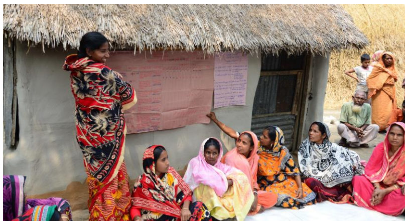
Es geht um ein Leben in Würde und Gerechtigkeit

Aus dem Jahresbericht des Vorjahres ist unseren Stiftern das Projekt in der Region Bundelkhand im Grenzbereich der nördlichen Bundesstaaten Uttar Pradesh und Madhya Pradesh bekannt. Verschiedene Umstände, besonders die Folgen des Klimawandels, haben das einst besonders fruchtbare Gebiet im Herzen Indiens in den Notstand getrieben. Darum war unsere RGAST gern bereit, dem Antrag der Andheri Hilfe zur Finanzierung des letzten Projektjahres zu entsprechen. Es ging um die gezielte Förderung von Frauen und Mädchen, in besonderer Weise diskriminiert.