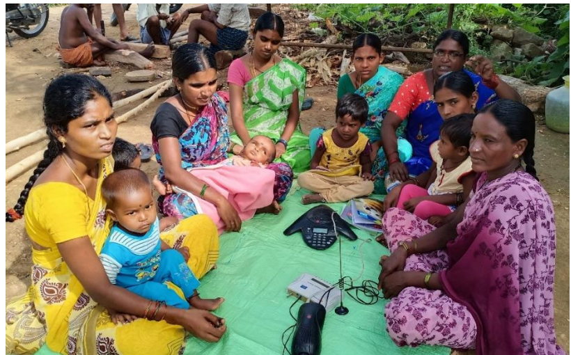
Mit Nottelefonen kann ärztliche Hilfe erreicht werden

Der Bildung im schulischen Bereich wird große Bedeutung zugemessen durch eigene Eltern-Lehrer-Komitees. Im letzten Jahr wurden 108 Kinder, die aus Armutsgründen zur Arbeit statt zur Schule gingen, wieder eingeschult.