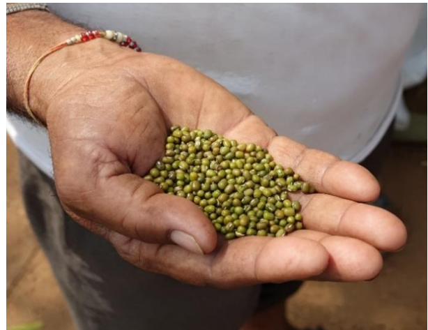
Klimaresistentes Saatgut hilft

Die Fakten standen bald fest: Zwar bestätigte sich in erster Linie die überaus harte Lebenssituation dieser Ureinwohner, die fast alle unterhalb der Armutsgrenze leben. Aber es zeigte sich auch sehr bald ihre volle Bereitschaft zur Mitarbeit bei den geplanten Maßnahmen. Davon überzeugt sagte auch das BMZ mit 75 % der Gesamtkosten seine Kofinanzierung für eine Dreieinhalb-Jahresphase zu.