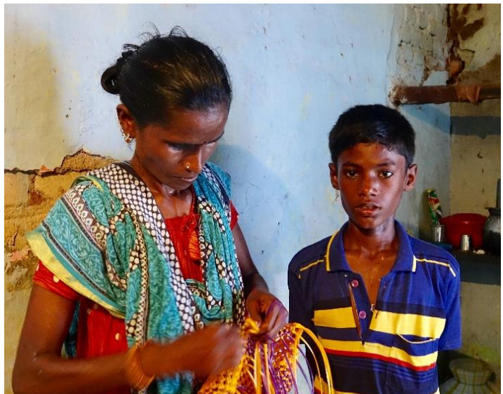
Heimarbeit hilft zum Überleben

In der jetzt begonnenen Abschlussphase geht es besonders darum, die Maßnahmen des Projekts zu einem guten Abschluss zu bringen und die Betroffenen in die Selbständigkeit zu entlassen. Wir haben es angepackt,