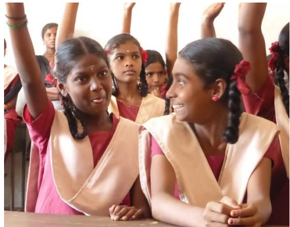
Lernen dürfen als große Chance

Nach dem ersten Probejahr erreichen uns bereits positive Rückmeldungen: Die jungen Mädchen - es werden nur die Allerärmsten unter ihnen ausgewählt - nehmen mit Eifer die Chance wahr, lernen zu dürfen. Durch Experten vor Ort ist eine Evaluierung geplant, die sich aber leider durch politische Unruhen verzögert. Wir versprechen unseren Stiftern , so bald als möglich - d.h. sobald der Prüfbericht vorliegt - über das Projekt zu berichten. Haben Sie bitte ein wenig Geduld, denn auch hier geht es um den