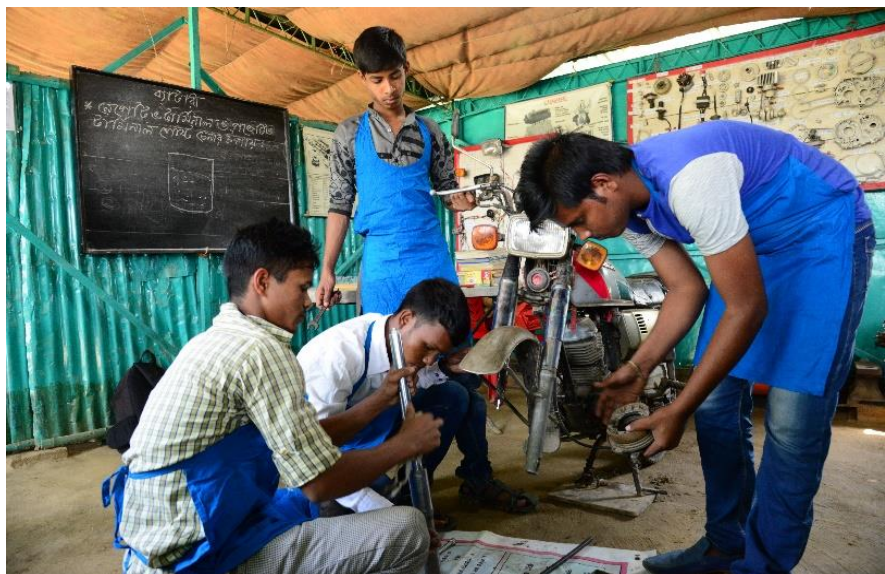
Mobile Ausbildung vor Ort bedeutet Zukunft

Es geht vorwiegend um praktische Lerninhalte. Zusätzlich erhalten die Azubis aber auch theoretische Anleitung