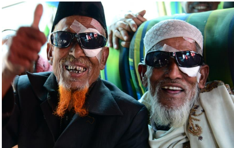
Glücklich nach gelungener Augenoperation

Es war zweifellos ein Wagnis, dieses Mammutproblem anzugehen, bis effektive Wege gezielter Hilfe gefunden waren. Nur Schritt für Schritt konnte das unglaubliche Ergebnis von bisher mehr als 1.400.000 Augenoperationen erreicht werden. Und nicht nur die Zahlen sind beeindruckend. Von großer Bedeutung ist der kontinuierliche Weg der eingesetzten Hilfsmaßnahmen. Stellte die Andheri Hilfe zu Anfang ein Klinikmobil für Untersuchung und Operation zur Verfügung, so wurden bald unter primitivsten Bedingungen Eye-Camps in Zelten, Schulen usw. durchgeführt. Eine gesunde Basis entstand bald durch die Errichtung von acht Basis-Augenkrankenhäusern über das ganze Land verteilt. Gleichzeitig ging man die Verhütung von Blindheit an durch Sehtest-Programme in Schulen. Die Aufklärung der Bevölkerung schloss sich an. Und mit der Errichtung des großen zentralen 150-Betten-Hospitals in Chittagong (gefördert vom BMZ) war auch die Ausbildung von lokalen Fachärzten und von Pflegepersonal garantiert. Der Weg vom einfachen Starstich mit Entfernung der getrübten Linse und Ersatz durch eine Einheitsbrille bis zur Implantation einer künstlichen Linse, westlichen Methoden vergleichbar, war dann nicht mehr weit. In der BNSB (Bangladesh National Society for the Blind) mit Dr. Rabiul Hussain an der Spitze, hatten wir einen kompetenten und engagierten Partner vor Ort gefunden.