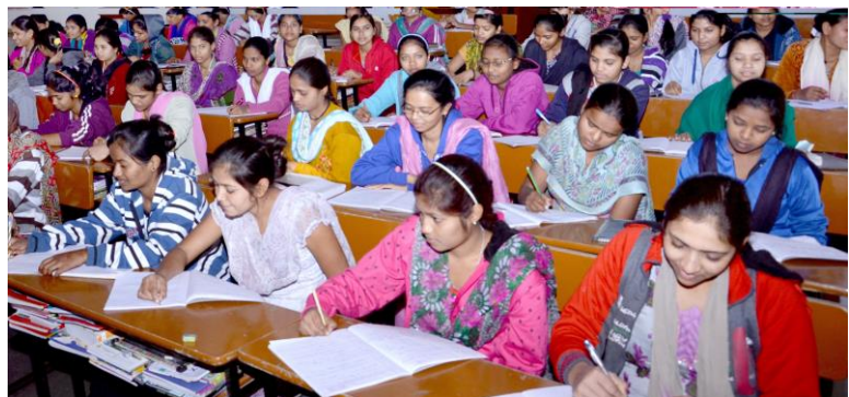
Chancen für junge Adivasi (Ureinwohner) durch Bildung

Leben , menschenwürdiges Leben mit Bildungschancen ohne Diskriminierung, das ist die große Hoffnung vieler der 7 % Adivasi (Ureinwohner) Indiens. Das trifft besonders für die 90 % dieser Zielgruppe im Gujarat-Bundestaat zu, die unterhalb der Armutsgrenze leben. Die Verbrauchsstifter von Licht und Leben haben hier ihre zweite besondere Zielgruppe. Im Career-Development-Training-Program werden junge Adivasi geschult, um für eine geeignete Ausbildung oder sogar für ein Studium die notwendigen Voraussetzungen mitzubringen. Wenn viele von ihnen später im öffentlichen Dienst oder in der Privatwirtschaft angemessene Arbeit finden, können sie aktiv beitragen zu sozialem Engagement und sich so für die Rechte ihrer Gemeinschaft einsetzen.